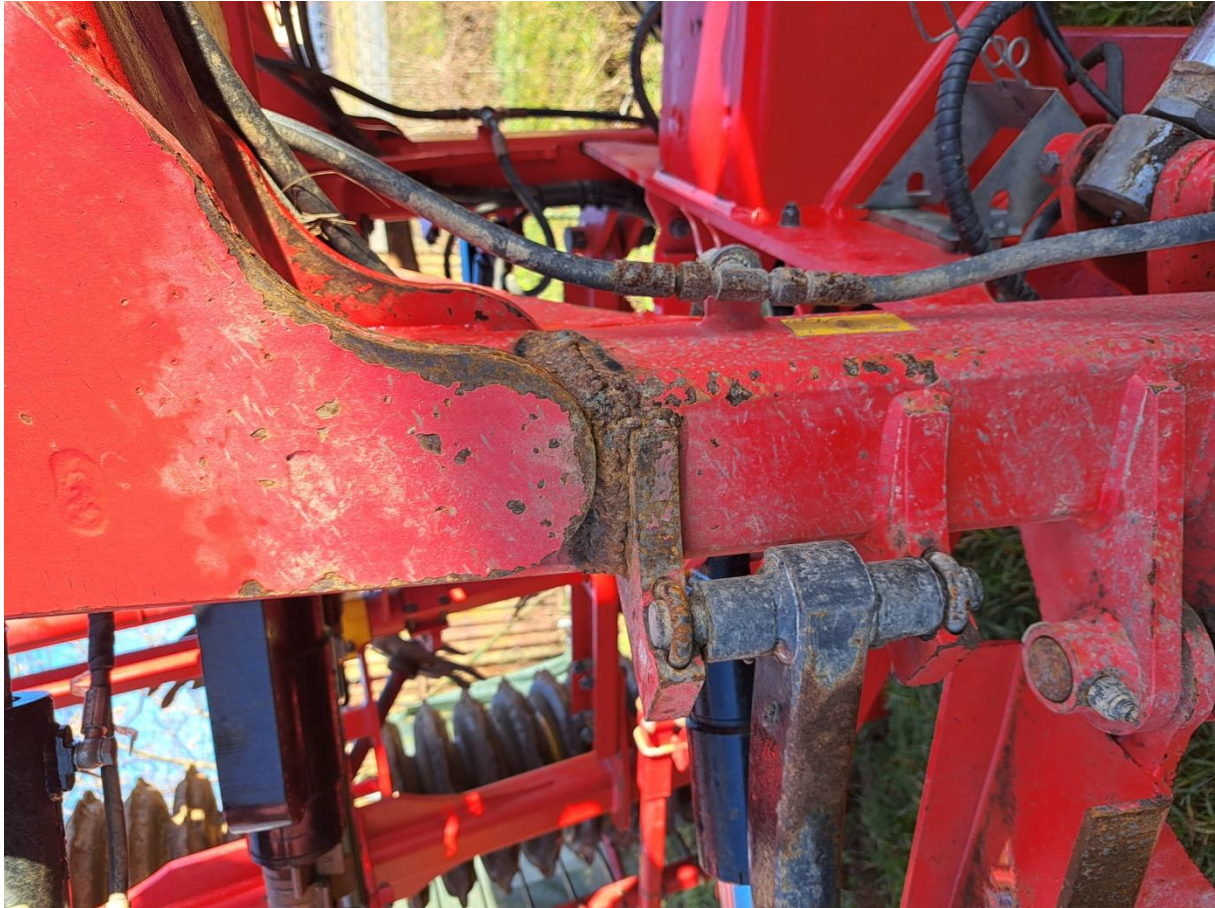
obr.: 2 nekvalitne a nedostatočne vykonaná oprava