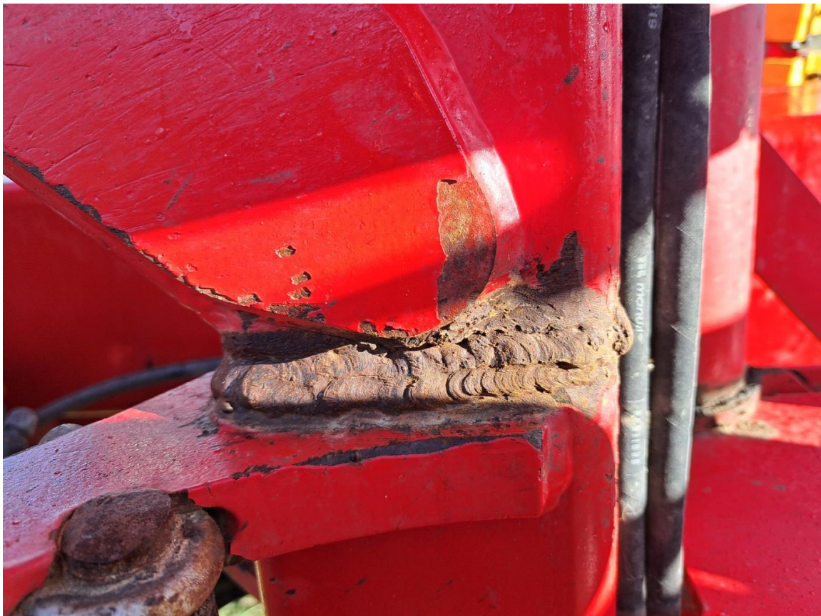
obr.: 1 nekvalitne a nedostatočne vykonaná oprava