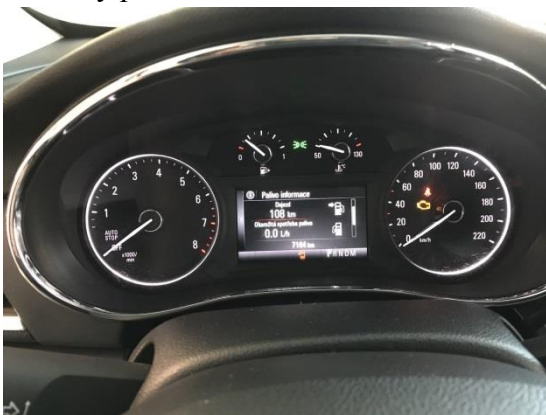
Sdružené přístroje vozidla