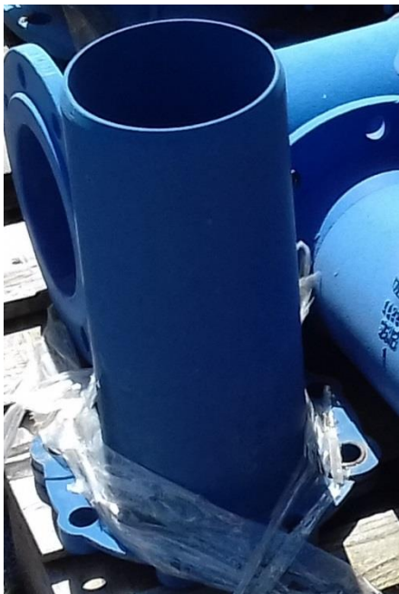
Prírub tvarovka liatina-F-Kus DN150 (L=0,4m)-1 ks