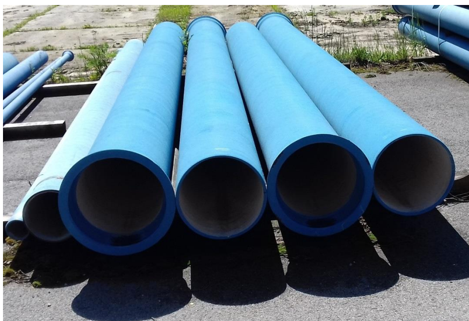
- Rúry liatina DN 400 = 4 ks (dĺžka 6,07 m), výrobca PAM