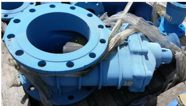
Posúvadlový uzáver (šupátko) DN 250 – 1ks