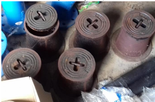
Poklop voda výška 0,20 m – 5 ks