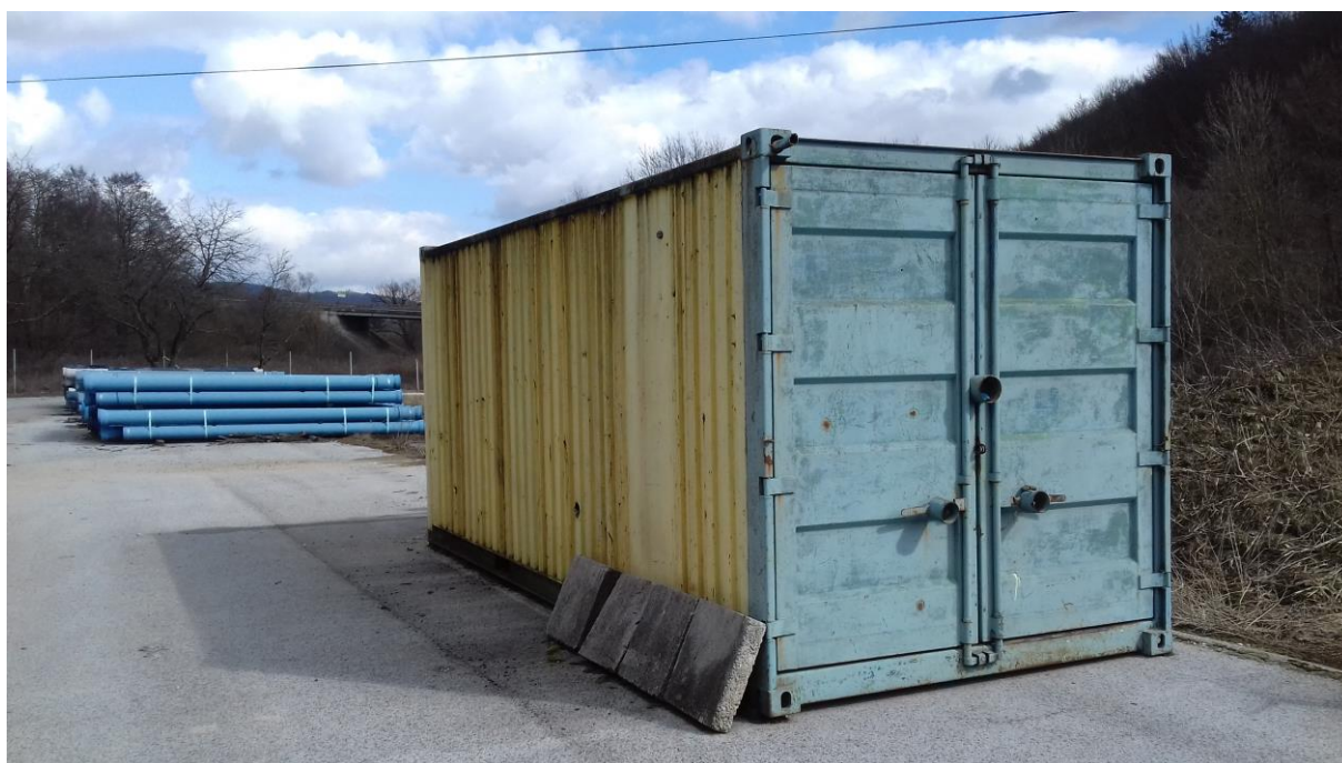
Skladový kontajner – 1 ks