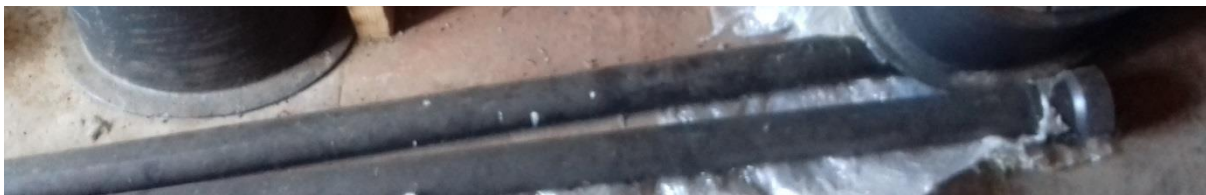
ZS teleskopická tyč DN 100-150 – 2 ks (L=2,5 m)