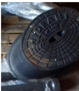
Poklop hydrantový výška 0,33 m – 1ks