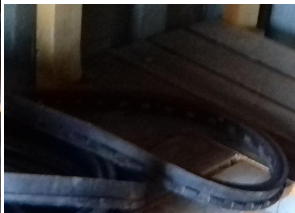
Zámkové tesnenie DN400 STD Vi - 1 ks