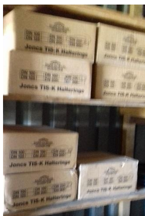
Zámkový krúžok DN 250 (6x7 krabíc) = 42 ks