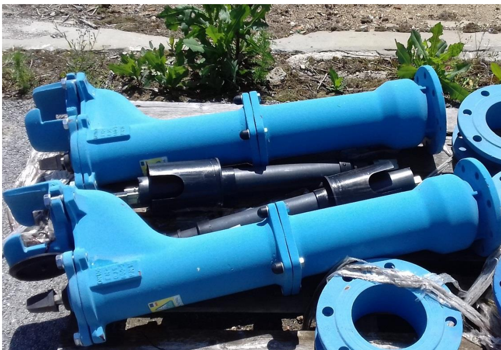
Podzemný hydrant – DN 100 – 2 ks