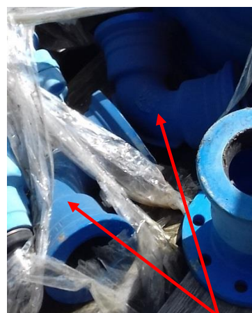
Tvarovka liatina – oblúk DN 80 - K 90°-2 ks