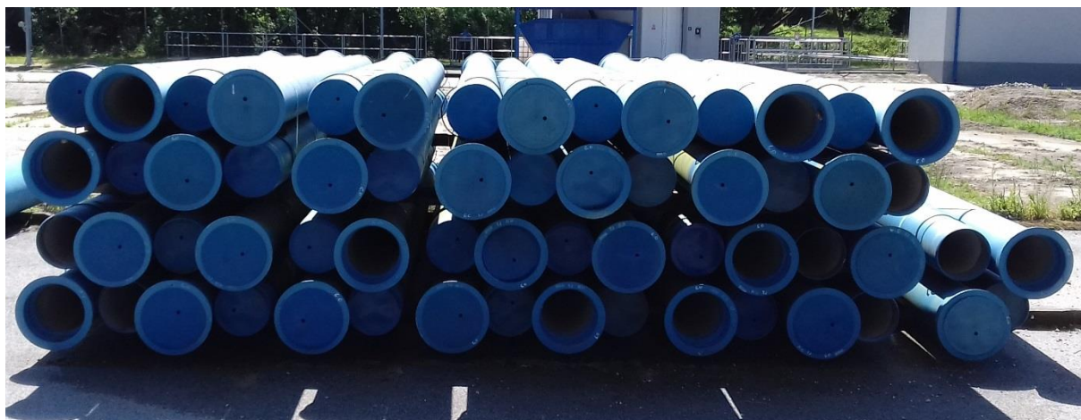
- Rúry liatina DN 250 = 60 ks (dĺžka 6,13 m)