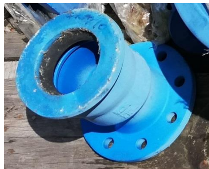
Prírub tvarovka liatina E-Kus DN80 - 1ks