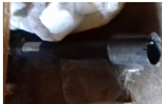
ZS teleskopická tyč DN 250-300 – 1 ks (L=1,4-1,8 m)