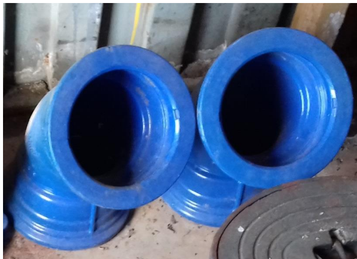
Tvarovka liatina – oblúk DN 150 – K 45° - 2 ks