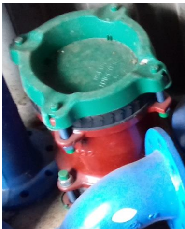
Spojka DN 150 (154 – 192) – 1 ks