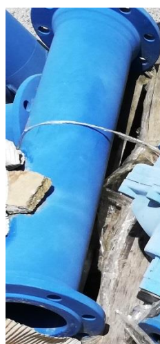
Tvarovka liatina-TP-Kus DN150 (L=0,8m)-1 ks