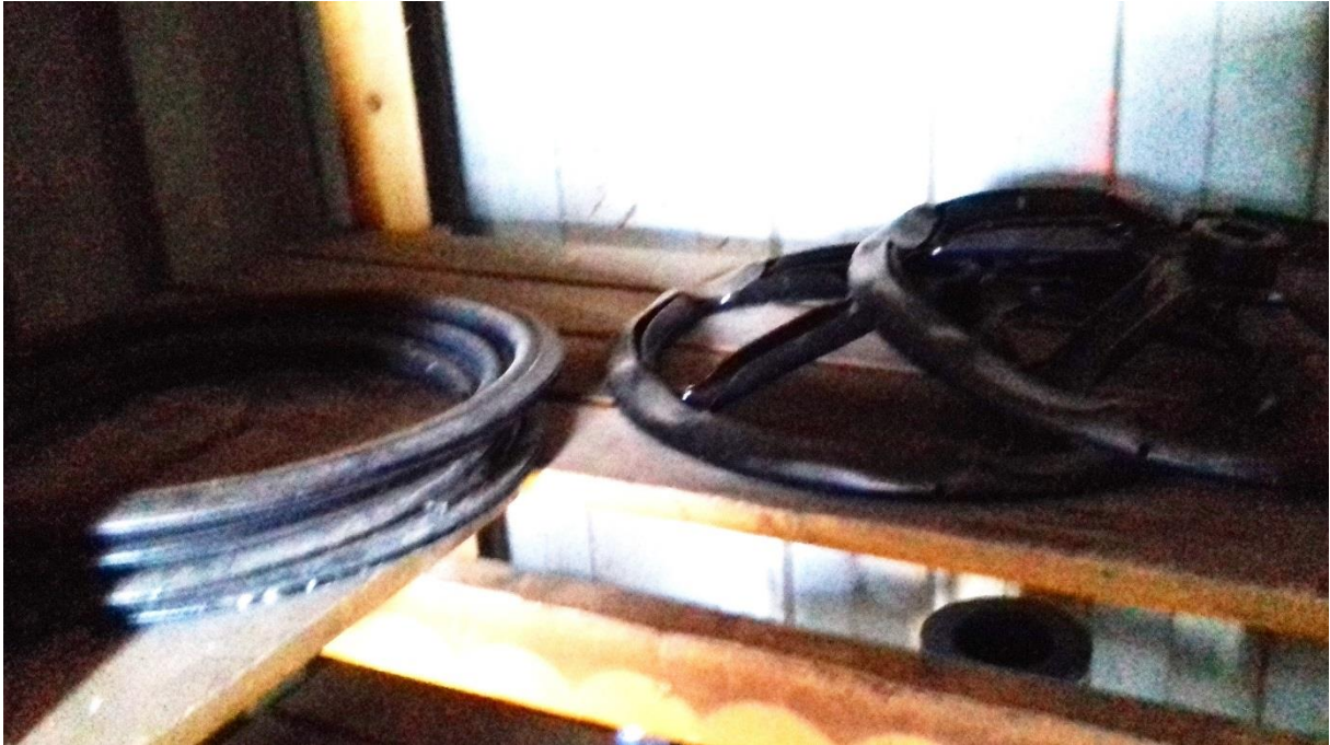
Ploché tesnenie DN350 - 2 ks, DN400 – 2 ks