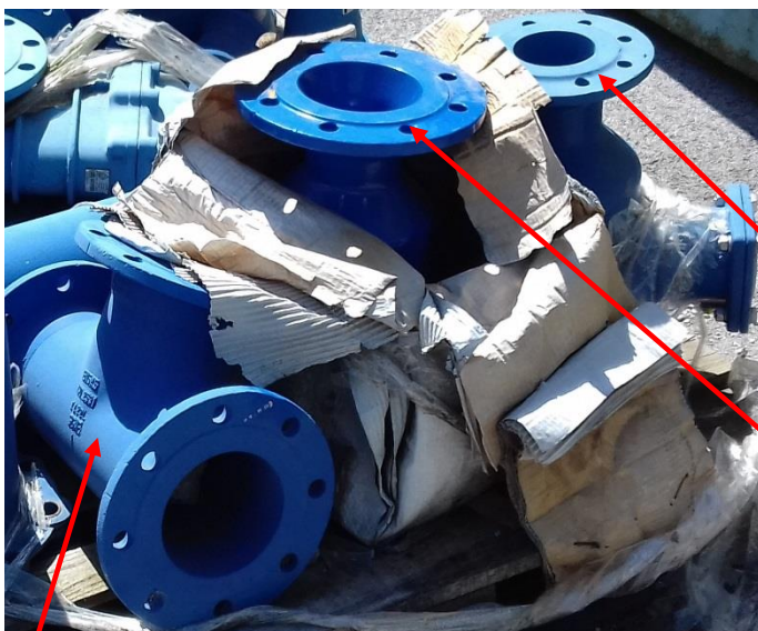
Prírub tvarovka liatina T-Kus DN150-1ks