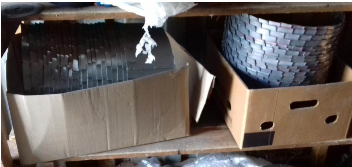
Límce pre zaťahovanie DN250 – 42 ks