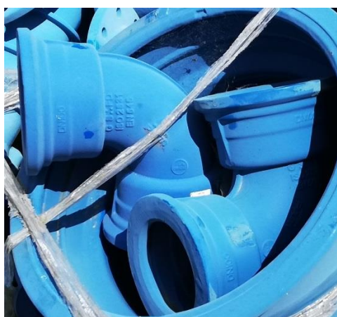
Tvarovka liatina – oblúk DN 100 - K 90°-3 ks