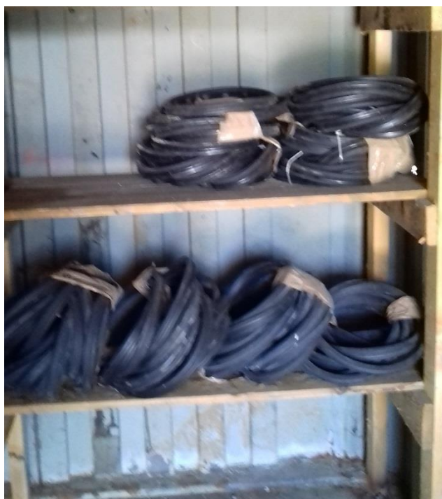
Zámkové tesnenie DN250 TYTON ( 10+10+11+6 ) = 37 ks