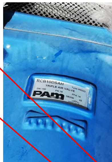
Automatický trojfunkčný vzdušník PAM MULTEX DN150-1ks DN100-1ks