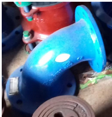
Prírubová tvarovka liatina oblúk DN 100 - K 90° - 1 ks