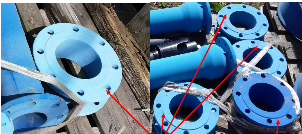
Prírubová tvarovka liatina – TP-Kus DN 150 – 4 ks (L=0,1m) a TP-Kus DN 150 – 1 ks (L=0,15m)