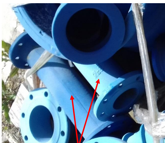
Tvarovka liatina-TP-Kus DN100 (L=0,5m)-2 ks