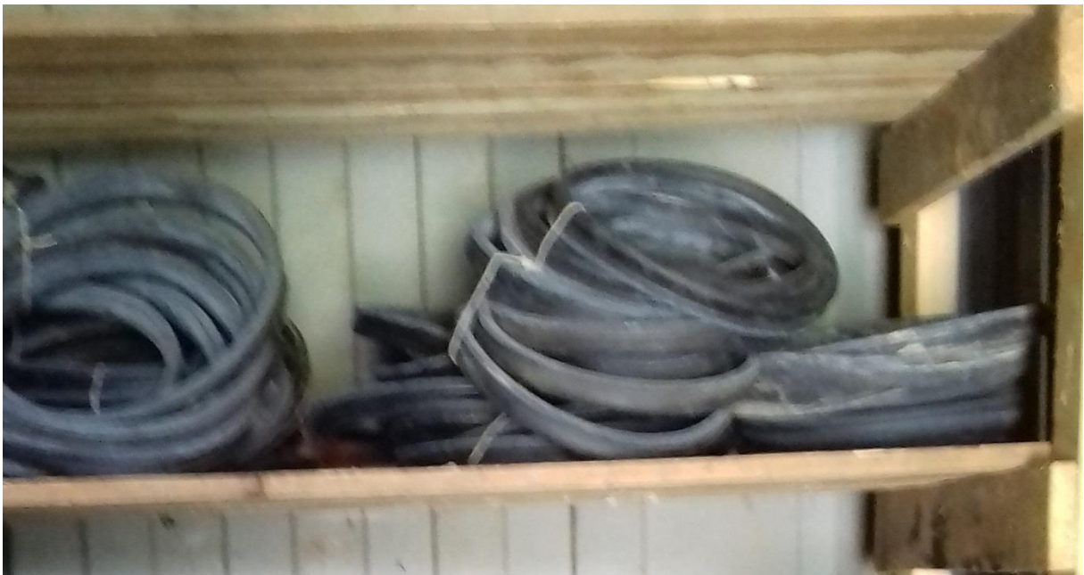
Gumové tesnenie DN250 TYTON = 46 ks