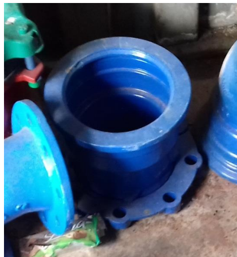
Prírub tvarovka liatina E-Kus DN150 -1ks