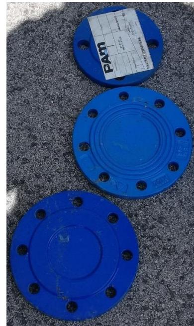
Zaslepovacia prírubas \varnothing 22 cm – 2ks