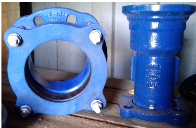
Prírubový adaptér UQ NG DN125-1ks a Prírubový E-Kus DN60-1ks