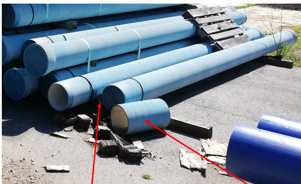
- Odrezok liatina DN 100 = 1 ks (dĺžka 4,7 m) a odrezok liatina DN 250 = 1 ks (dĺžka 0,5 m)