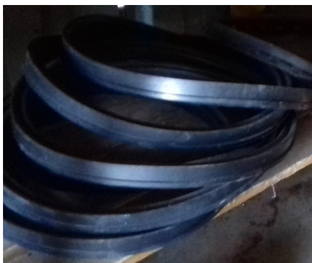
Gumové tesnenie DN400 STD – 6 ks