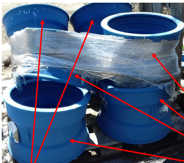
Tvarovka liatina – oblúk DN 400 - K 45° -2 ks