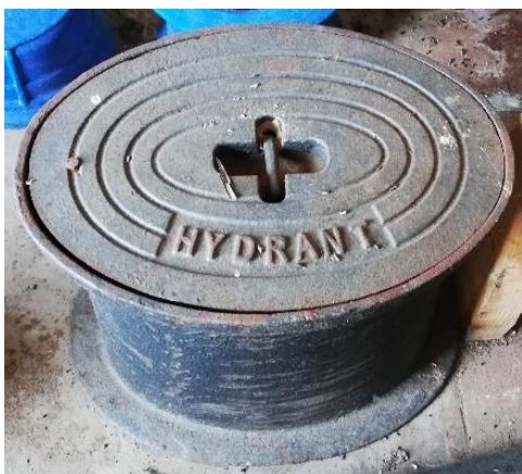
Poklop hydrantový v. 0,30m-1ks