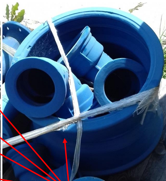
Tvarovka liatina – oblúk DN 400 - K 11,25° - 5 ks