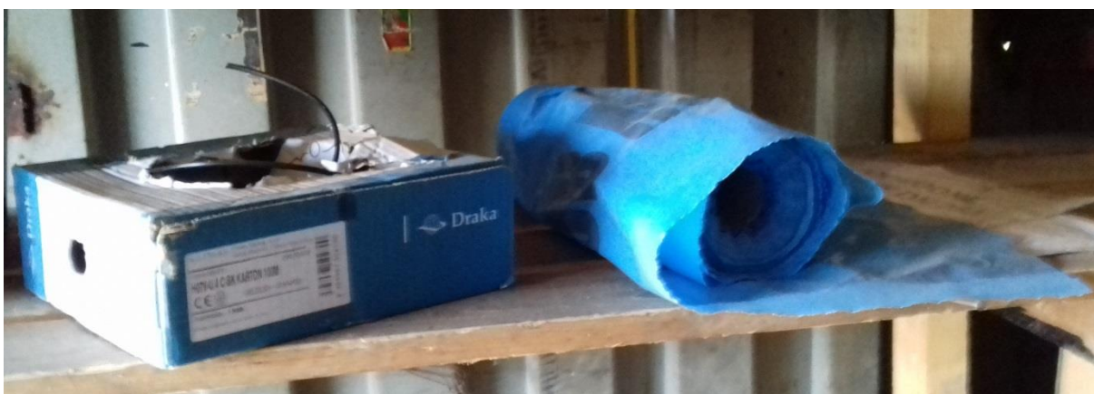
Elektrický vodič – 10 m, Fólia – 20 m