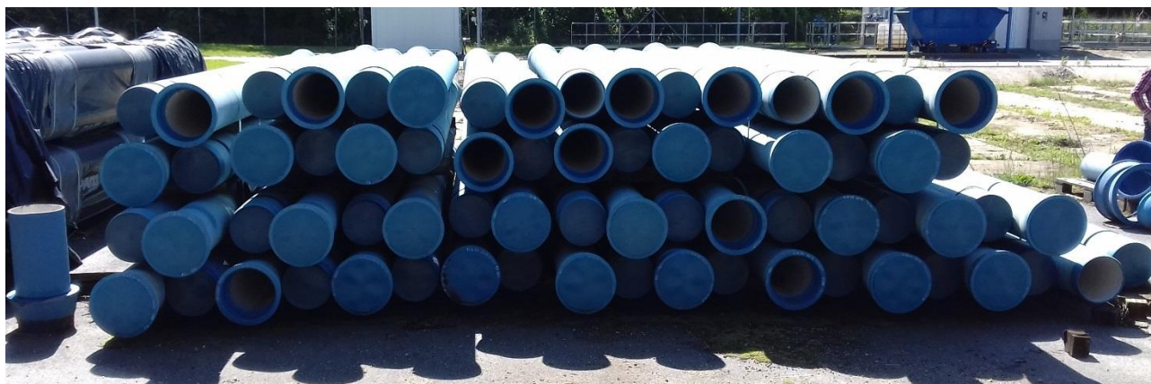
- Rúry liatina DN 250 = 70 ks (dĺžka 5,63 m), výrobca SERTUBI