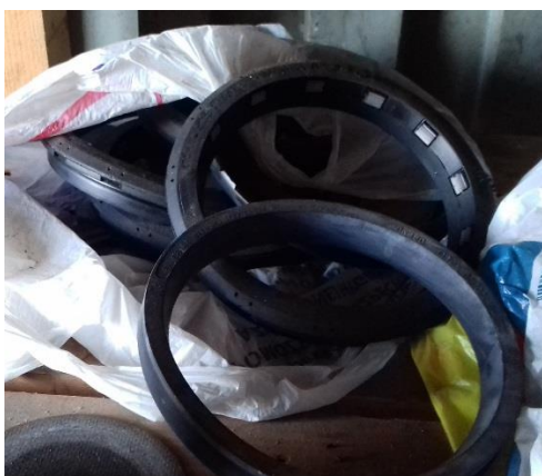
Zámkové tesnenie DN 150 STD Vi – 6 ks