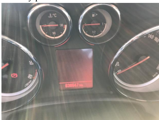
Sdružené přístroje vozidla