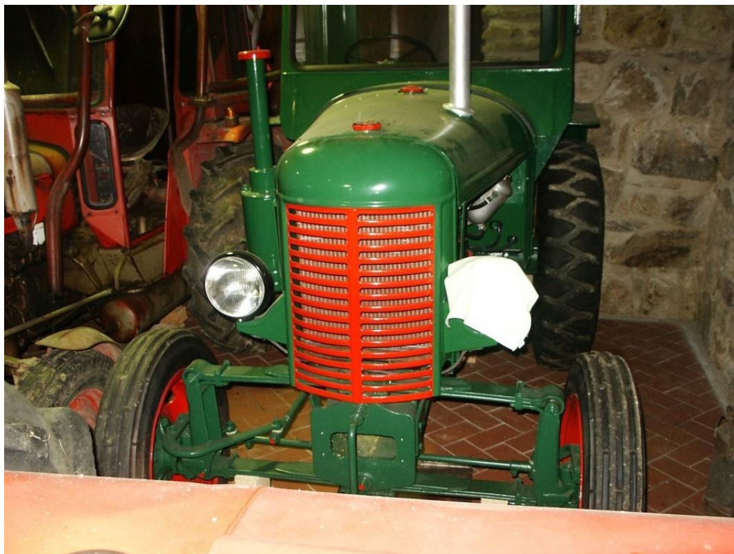
vozidlo č. 7