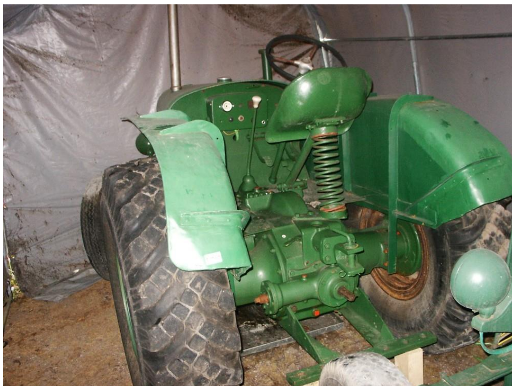
vozidlo č. 6