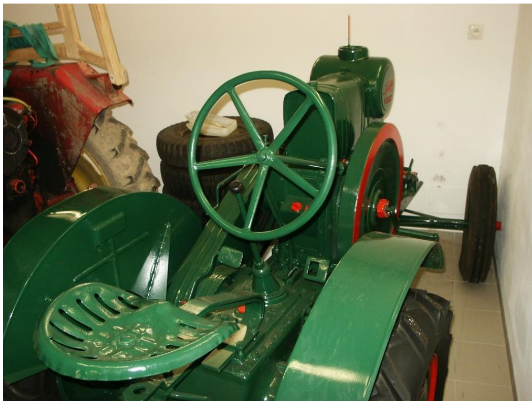
vozidlo č. 1