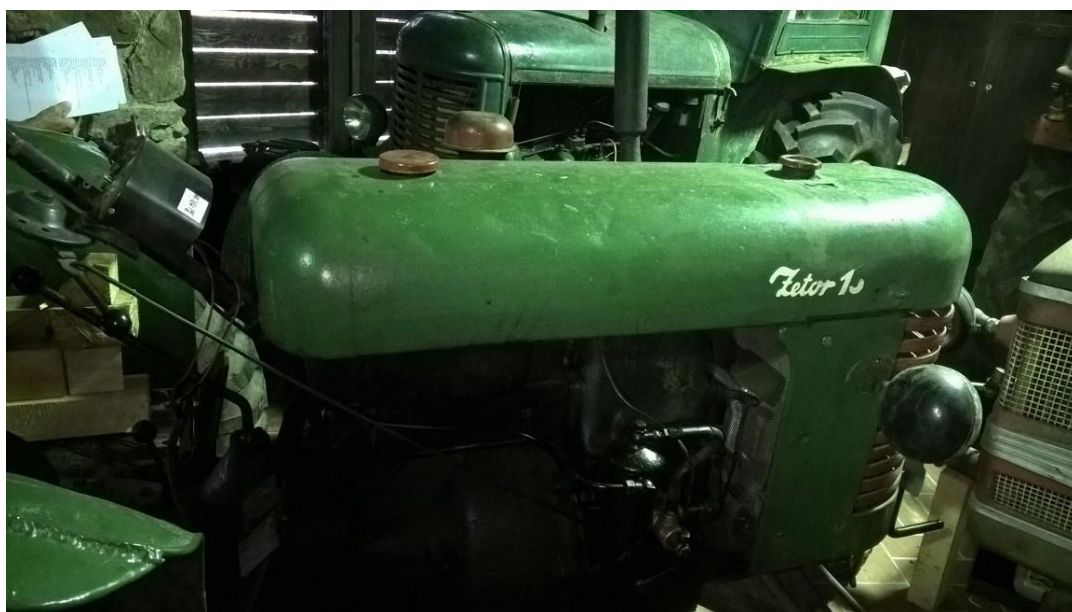
vozidlo č. 9