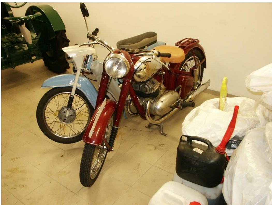
vozidlo č. 20