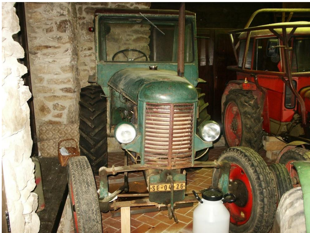
vozidlo č. 3