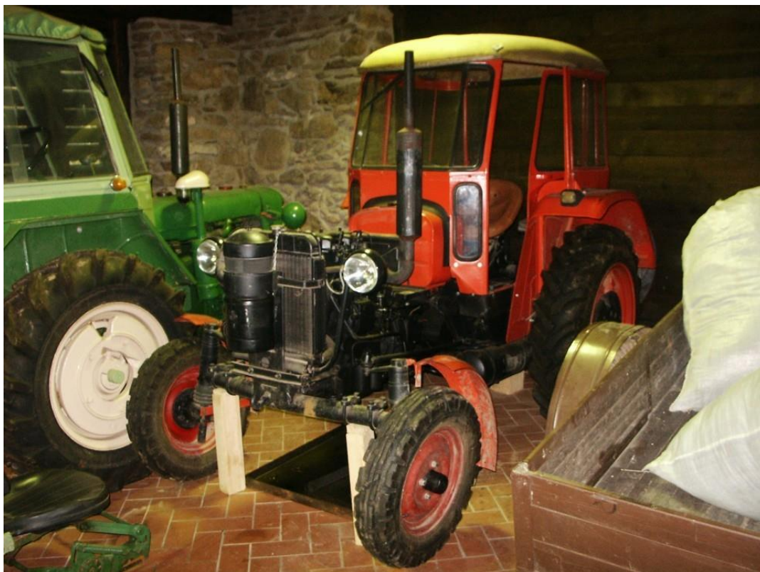
vozidlo č. 13