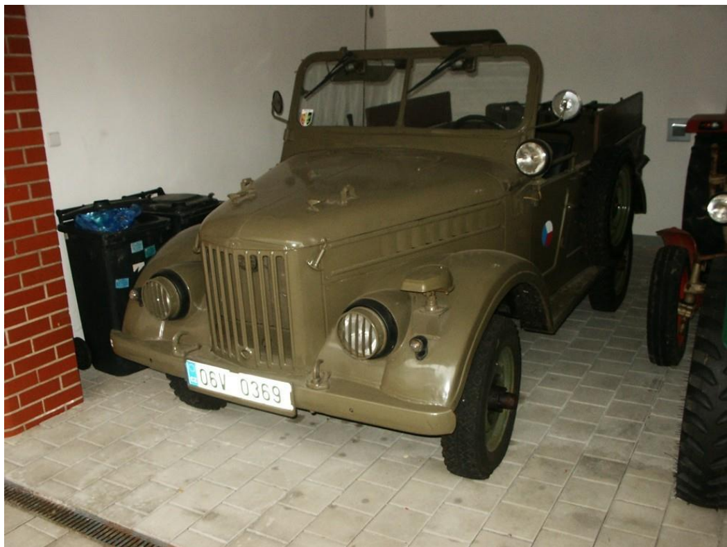
vozidlo č. 19