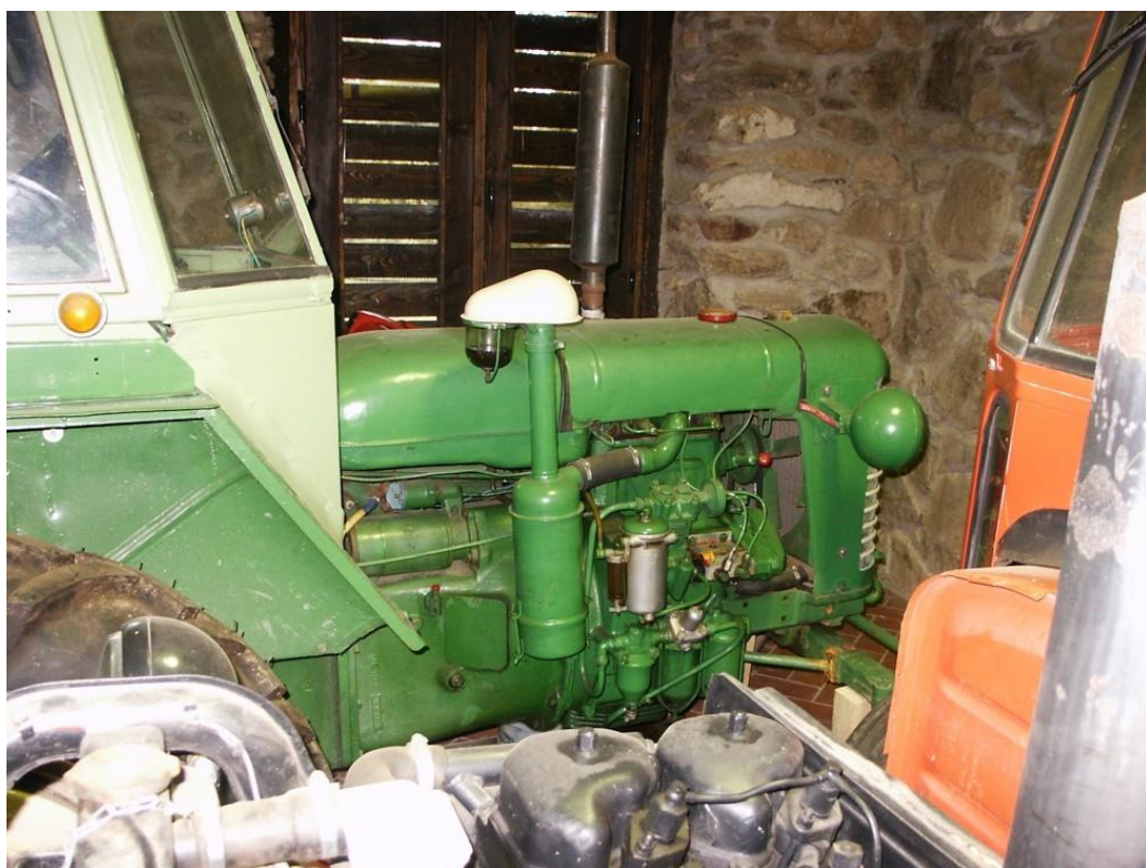
vozidlo č. 11