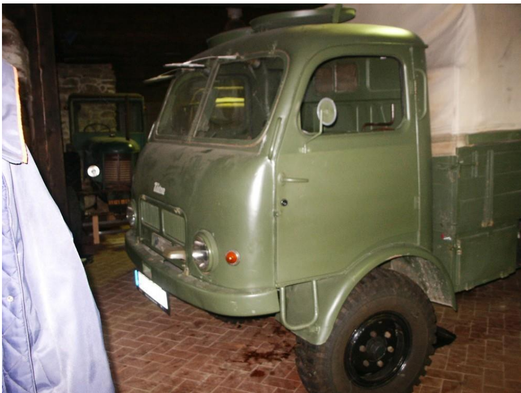
vozidlo č. 18