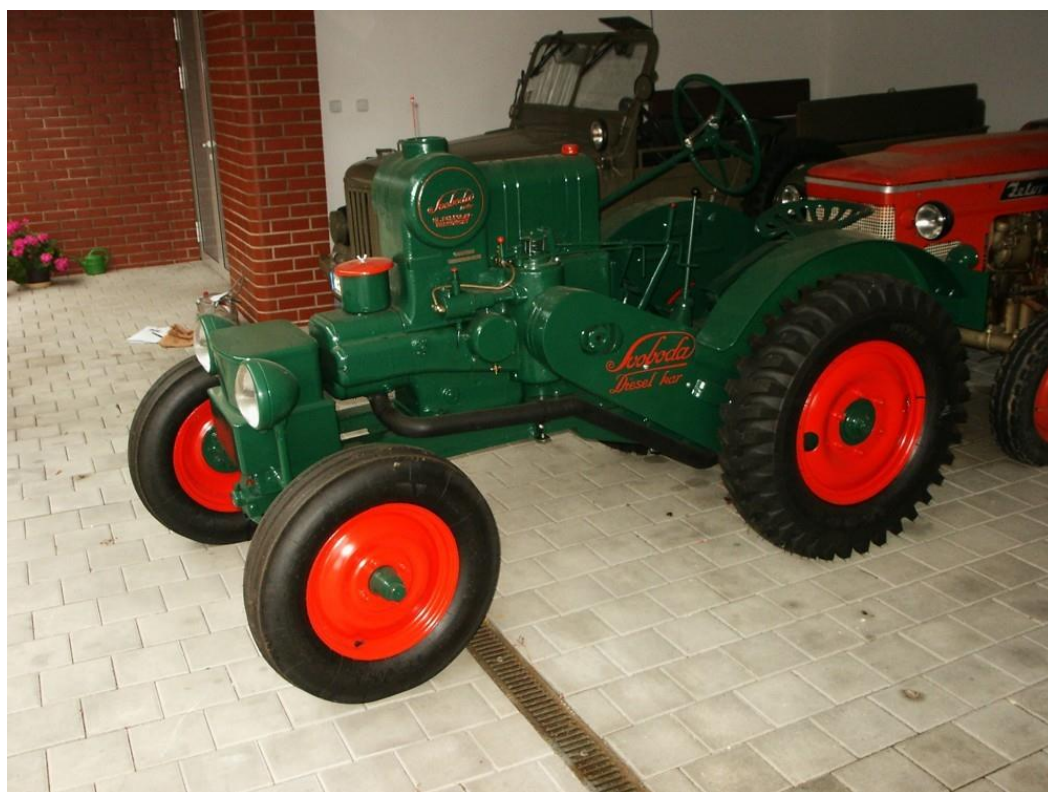
vozidlo č. 2