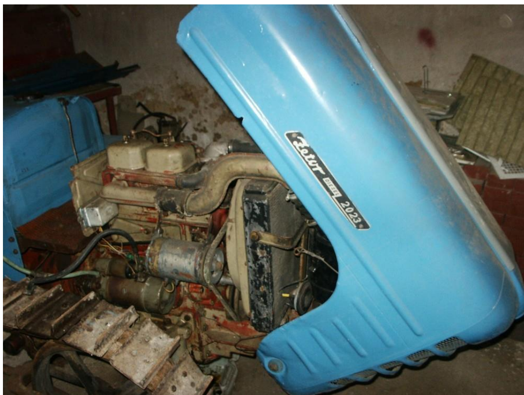
vozidlo č. 16