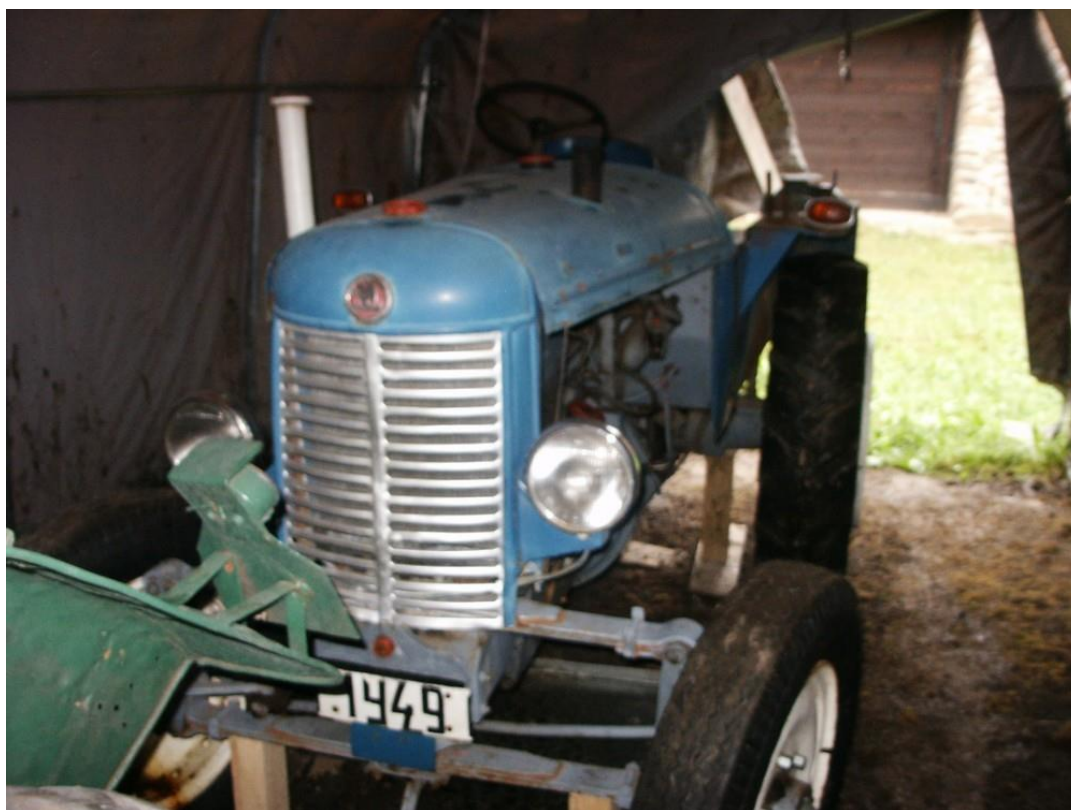
vozidlo č. 8