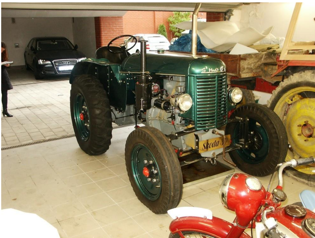
vozidlo č. 4