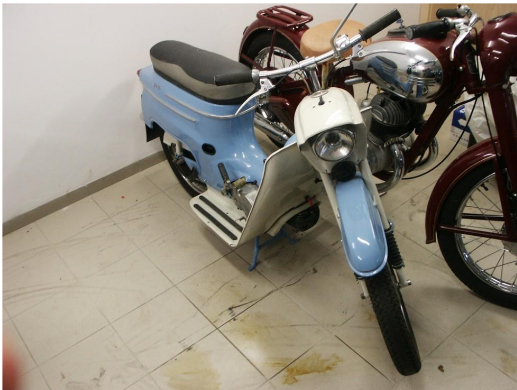
vozidlo č. 21