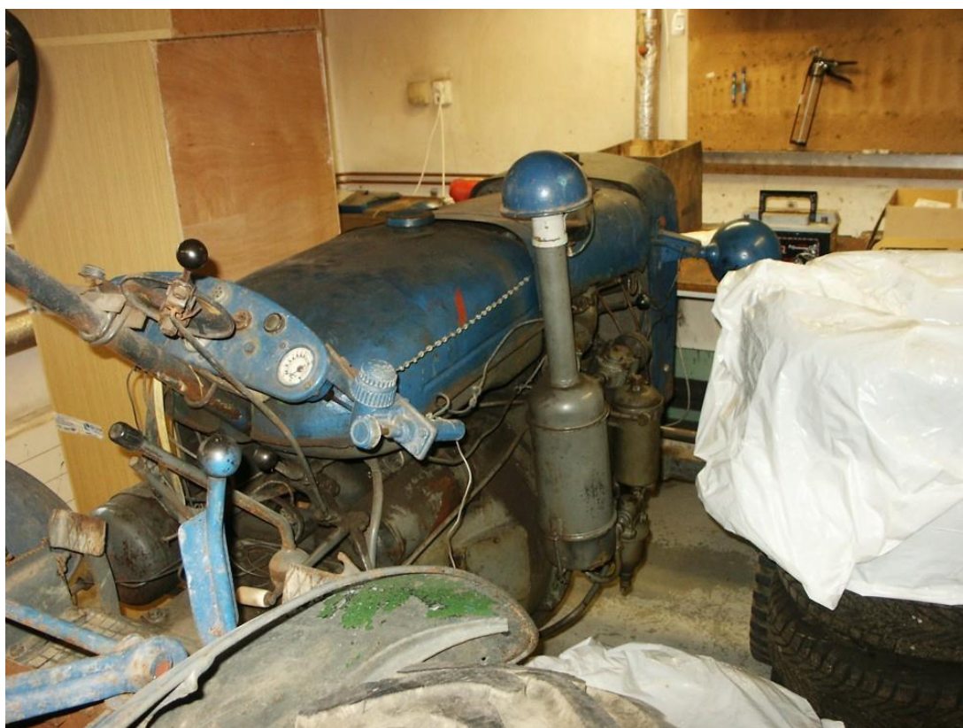
vozidlo č. 10