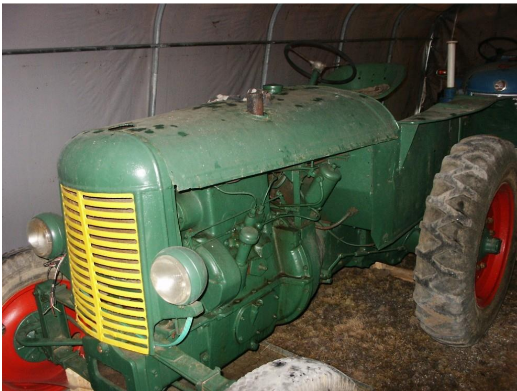
vozidlo č. 5