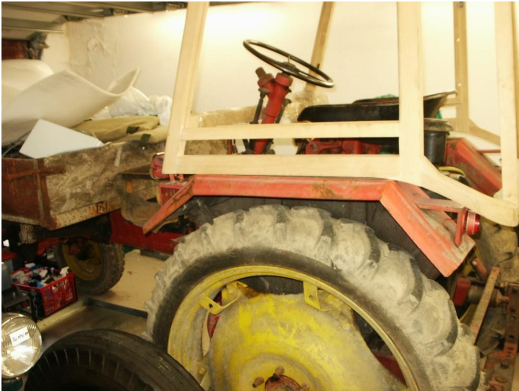
vozidlo č. 17