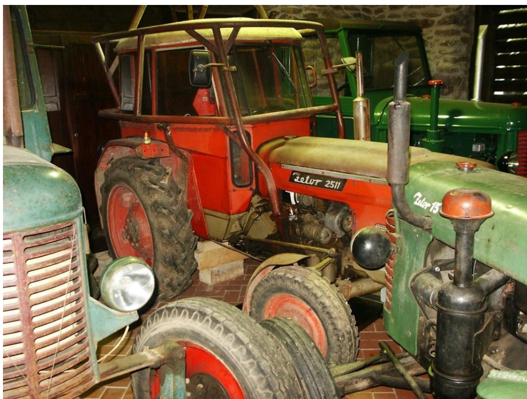
vozidlo č. 14