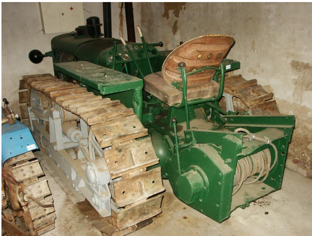
vozidlo č. 15