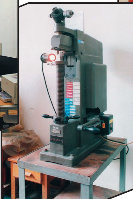
Trhací stroj AMSLER: 200 kN Tensile test machine AMSLER: 200 kN