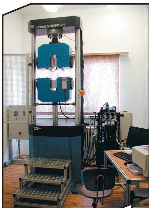
Trhací stroj LabTest 5.600 SP1-VH: 600 kN Tensile test machine Lab Test 5.600 SP1-VH: 600 kN