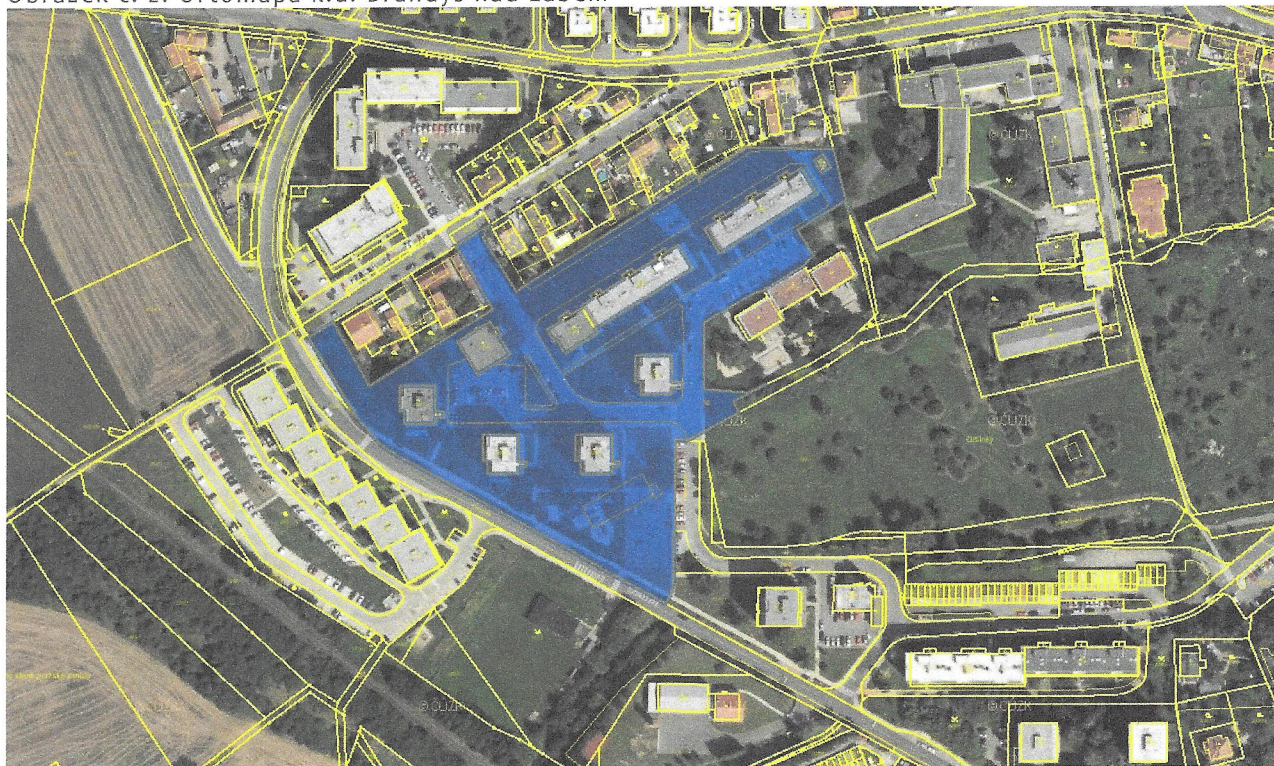
Obrázek č. 2: Ortomapa k.ú. Brandýs nad Labem