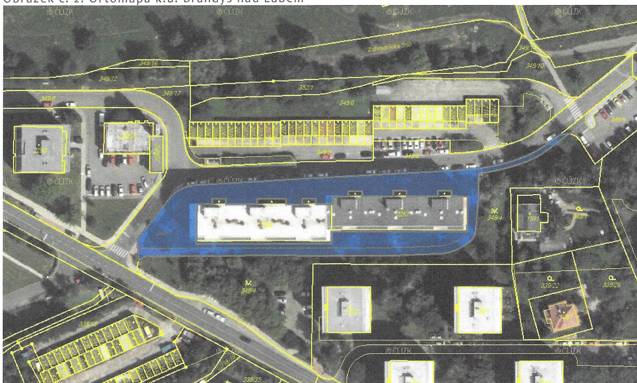
Obrázek č. 2: Ortomapa k.ú. Brandýs nad Labem