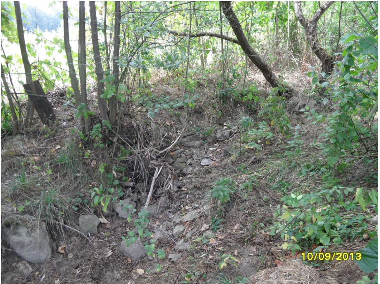
Pozemek parcelní číslo 149 - koryto vodního toku v katastrálním území Osová, obec Osová Bítýška, okres Žďár nad Sázavou ležící mezi výše zpnázorněnými plochami.