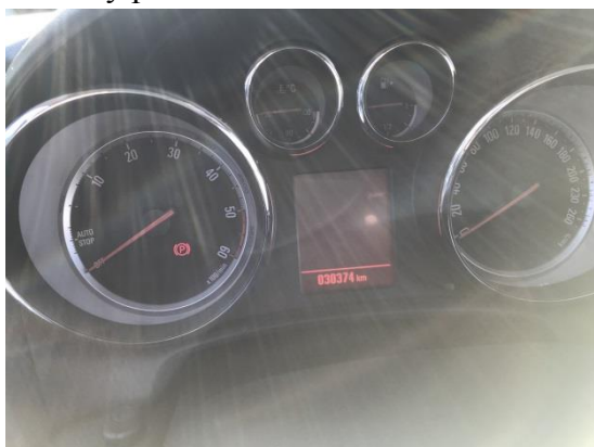
Sdružené přístroje vozidla