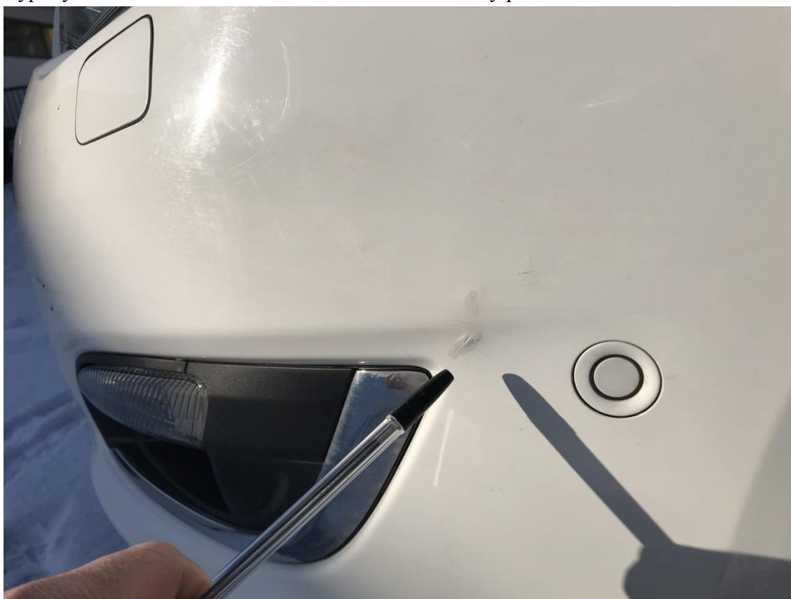
Oděrka předního nárazníku