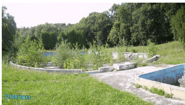
Koupaliště na p.p.č. 350/8 (vpravo vodotrysk)