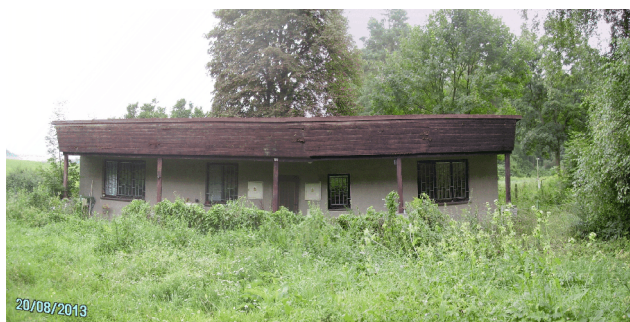
Budova č.p. 155 na p.p.č. 347