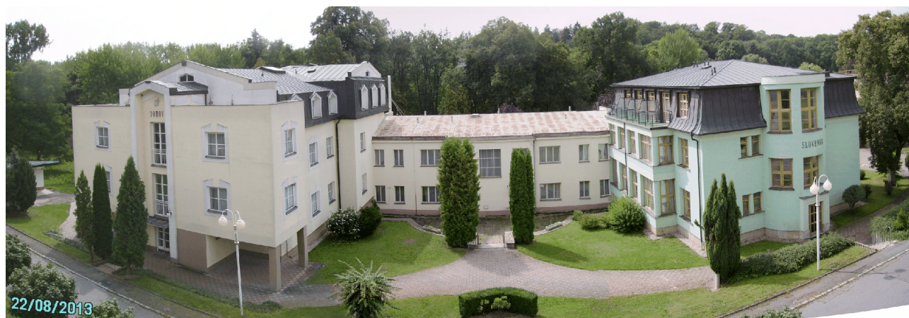
Zleva: budova č.p. 63 na p.p.č. 70 („Domov“) a dvě budovy s jedním č.p. 64 na p.p.č. 71 („Zimní lázně“ a „Slovenka“)