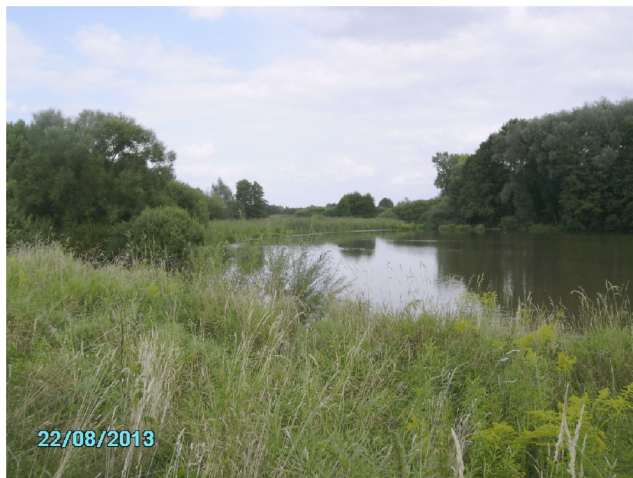
Ložisko slatiny v k.ú. Velichovky a k.ú. Rožnov