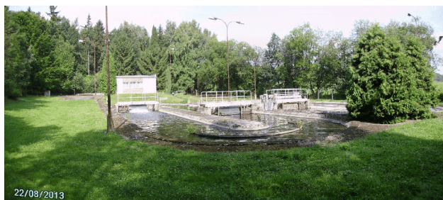
Čistírna odpadních vod na p.p.č. 311