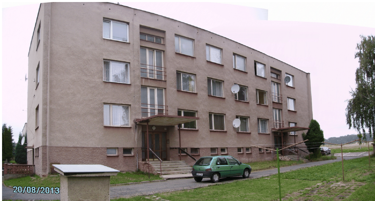
Budova č.p. 126 a 127 na p.p.č. 440 a 441