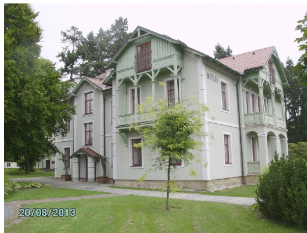
Budova č.p. 69 na p.p.č. 78 („Čechie“) a budova č.p. 68 na p.p.č. 79 („Morava“)