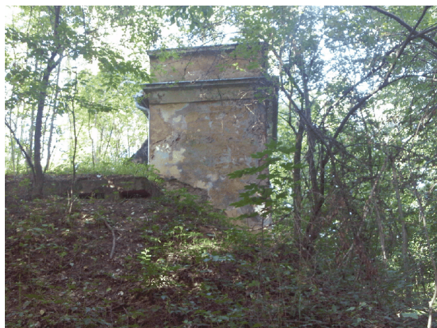
Vodárna na p.p.č. 303 (pozemek jiného vlastníka) a vodojem na p.p.č. 113