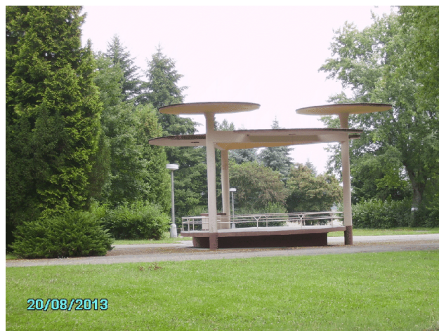
Hudební pavilon na p.p.č. 109 v lázeňském parku