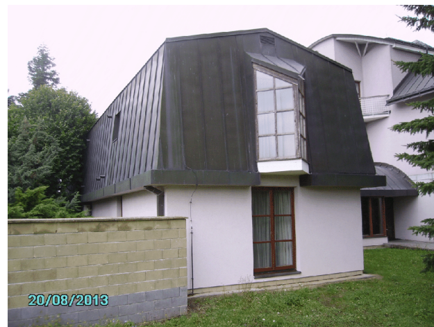
Budova č.p. 66 na p.p.č. 73/1 („Zátiší“) - hlavní budova a přístavba