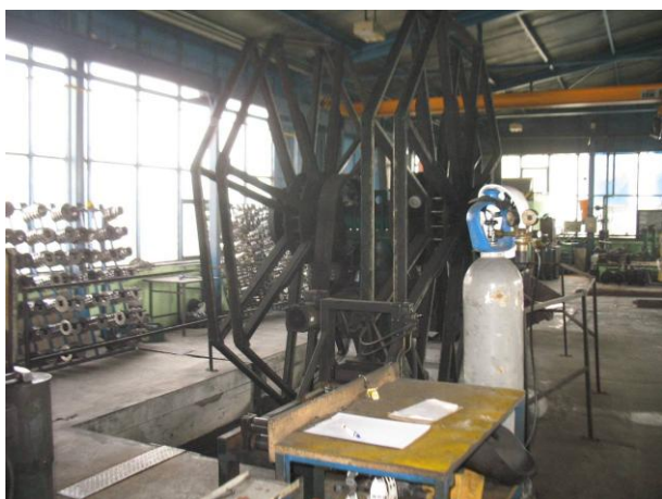
Foto 15 Válcovací linka SP 2 - dvoububnový akumulátor