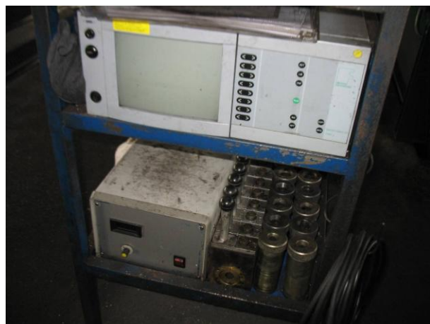
Foto 20 Válcovací linka SP 2 - elektronika defektomatu CP 2.842