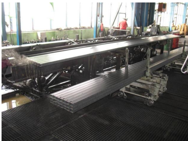
Foto 13 Válcovací linka SP 3 - výběhový stůl