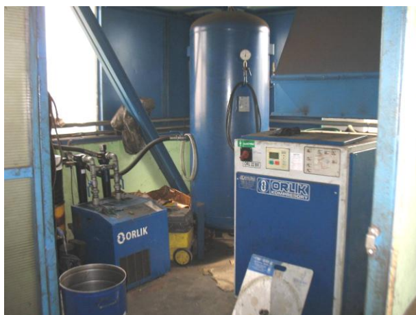
Foto 28 Kompresor šroubový