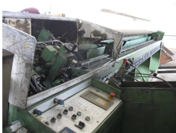
Foto 24 Dělicí linka ADIGE