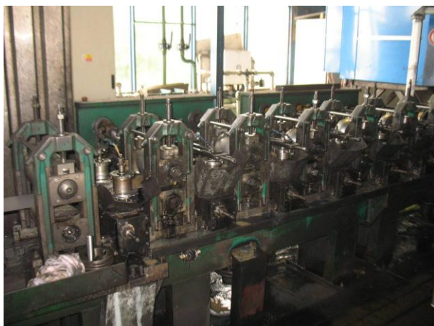
Foto 7 Válcovací linka SP 3 - profilovací část