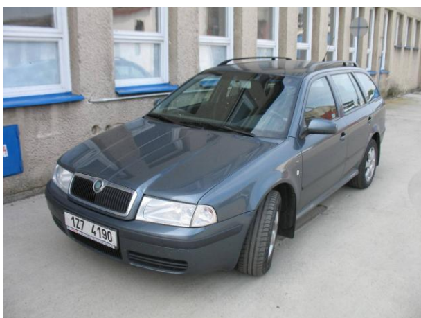
Foto 35 Škoda Octavia kombi