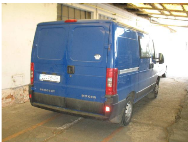
Foto 33 Peugeot Boxer