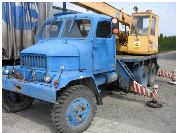
Foto 30 Autojeřáb P V3S/ČKD AD 80