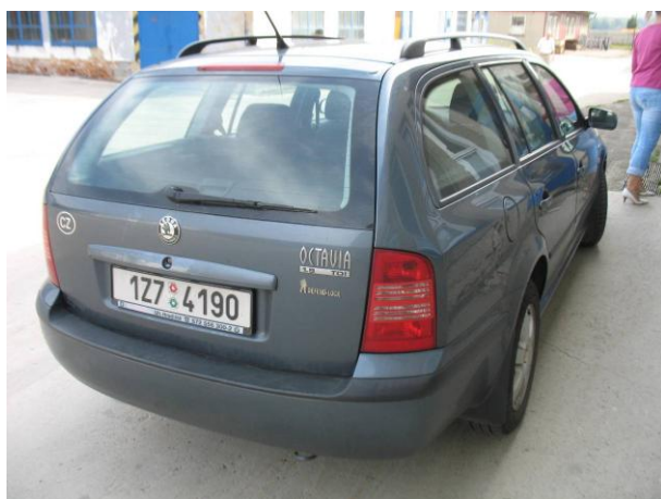
Foto 36 Škoda Octavia kombi