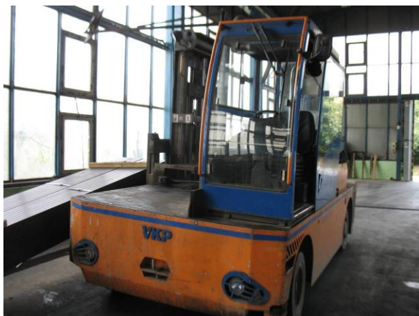
Foto 37 VZV boční SB 50Q-40 7