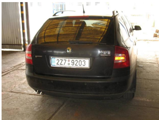
Foto 32 Škoda Octavia kombi 4x4