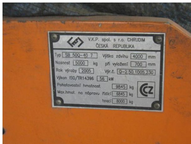
Foto 38 Výrobní štítek VZV boční SB 50Q-407