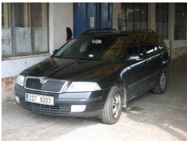
Foto 31 Škoda Octavia kombi 4x4