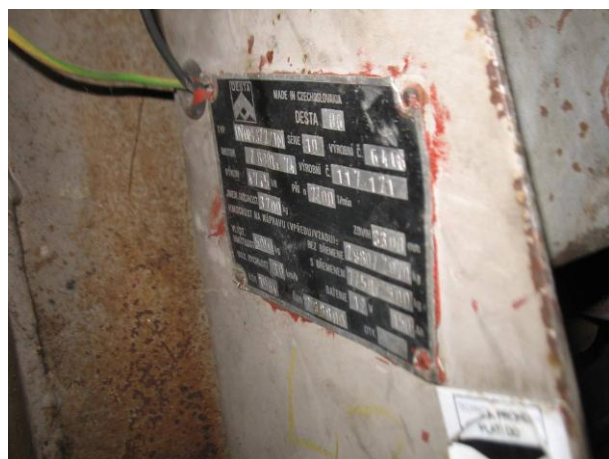
Foto 40 Výrobní štítek VZV DVHM 3222 TM