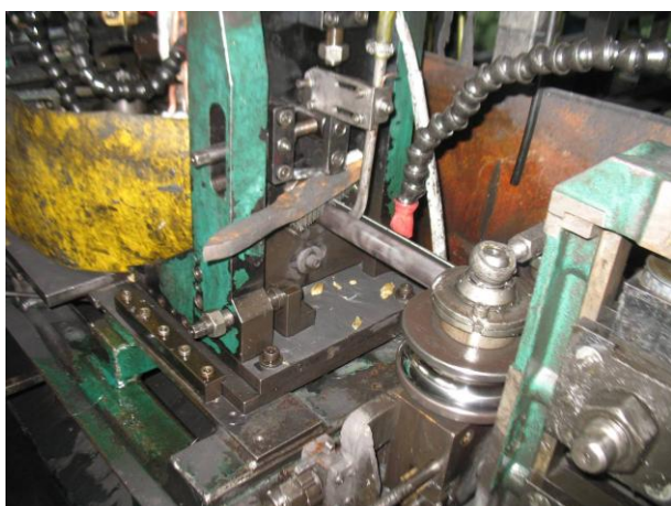
Foto 17 Válcovací linka SP 2 - svařovací agregát