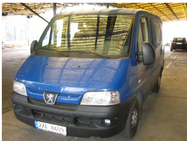
Foto 34 Peugeot Boxer