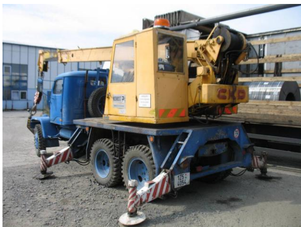
Foto 29 Autojeřáb P V3S/ČKD AD 80