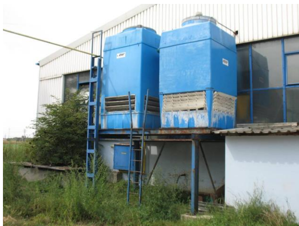
Foto 26 Chladicí věž