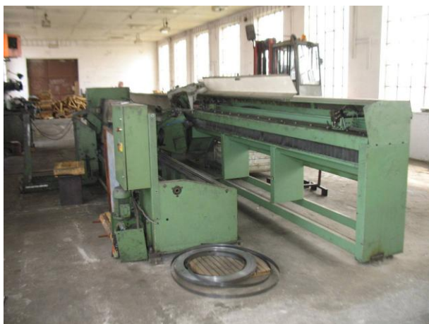
Foto 23 Dělicí linka ADIGE