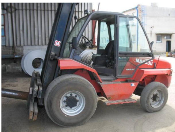
Foto 41 VZV MANITOU BF