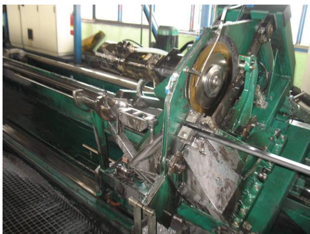
Foto 21 Válcovací linka SP 2 - letmé dělení