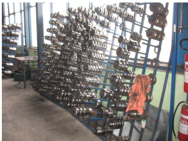
Foto 14 Válcovací linka SP 2 - nářadí, formovací válce