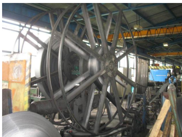
Foto 6 Válcovací linka SP 3 - dvoububnový akumulátor