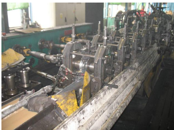
Foto 9 Válcovací linka SP 3 - tvarovací část