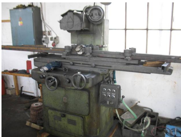
Foto 25 Bruska BPH 20