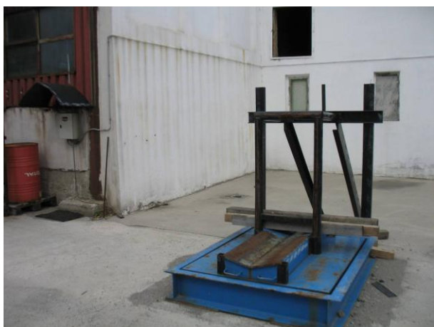
Foto 27 Plošinová váha