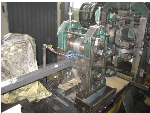
Foto 10 Válcovací linka SP 3 - kalibrovací část, vlevo zakrytá hlava defektometru