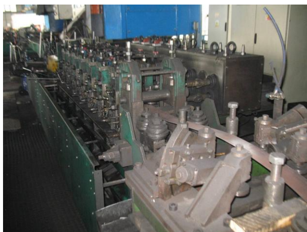
Foto 16 Válcovací linka SP 2 - profilovací část