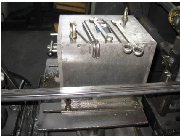
Foto 19 Válcovací linka SP 2 - defektomat CP 2.842