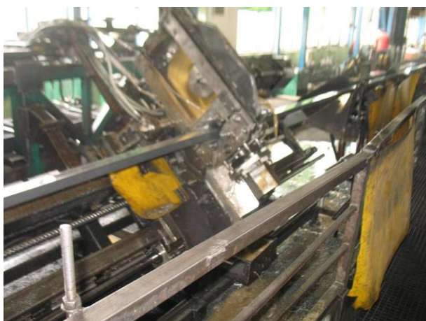
Foto 12 Válcovací linka SP 3 - letmé dělení profilů