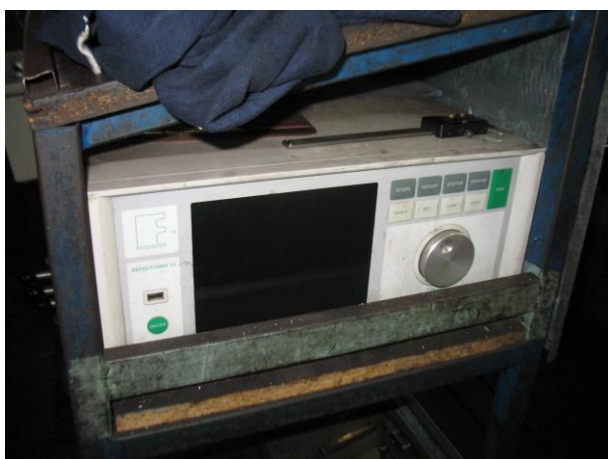
Foto 11 Válcovací linka SP 3 - elektronika defektometru CI 2.812