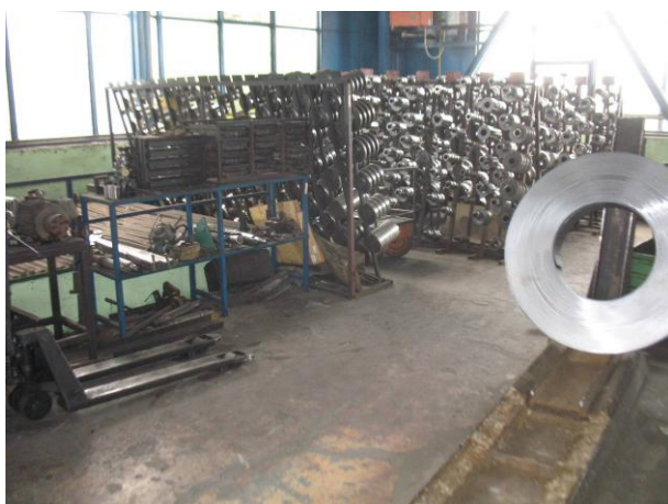
Foto 5 Válcovací linka SP 3 - nářadí, formovací válce