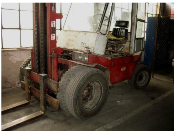
Foto 39 VZV DVHM 3222 TM