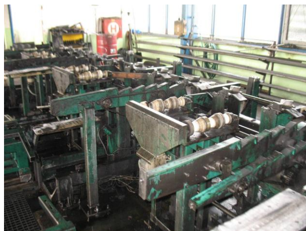
Foto 22 Válcovací linka SP 2 - výběhový stůl