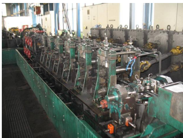
Foto 18 Válcovací linka SP 2 - kalibrační stolice