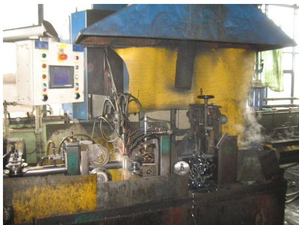
Foto 8 Válcovací linka SP 3 - svařovací agregát