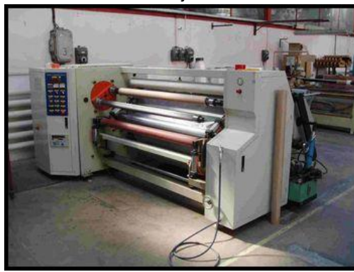
18. Dvouhřídelový převíjecí stroj RQ-1600B ( WQ-802 )