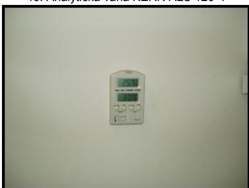
49. Digitální teploměr a vlhkoměr