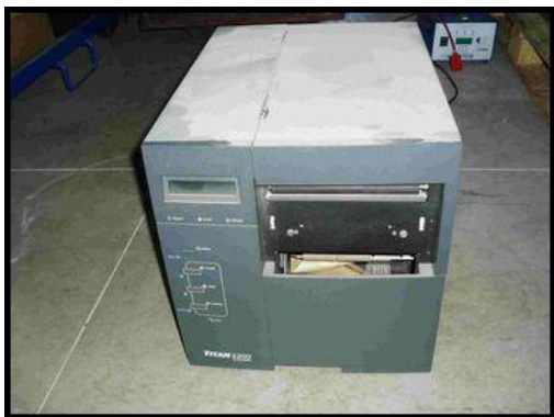
56. Termotiskárna Titan 6200