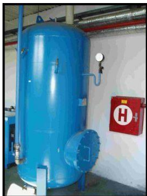
17. Vzdušník VSV 11