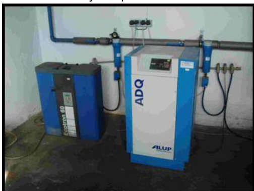
15. Pračka vzduchu ADQ 360