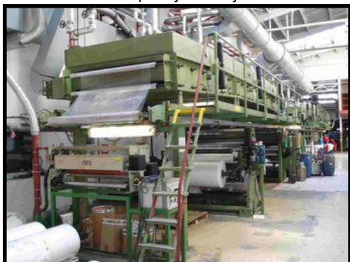
3. Linka Interplastica