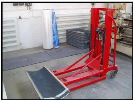
41.-42. Ruční paletový vozík