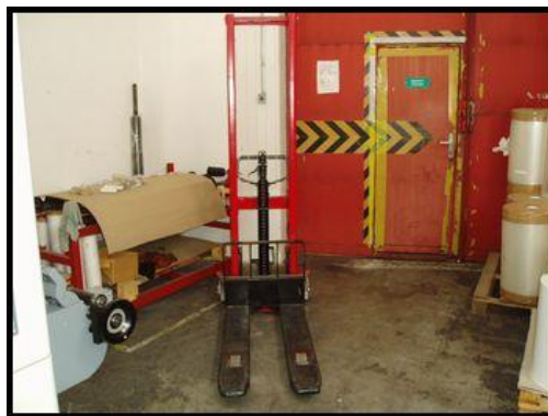
43. Ruční paletový vozík vysokozdvížený SDJ 1000