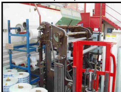
34. Převíjecí stroj DECIN