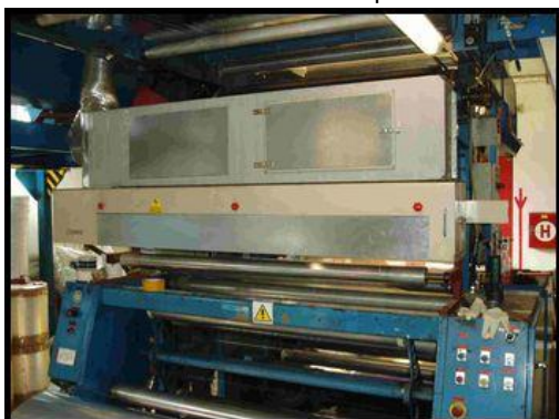
25. Korona k výrobě samolep.pásek