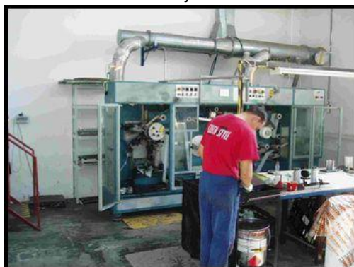
26. Potiskovací stroj SIAT L36/150/TC-CE