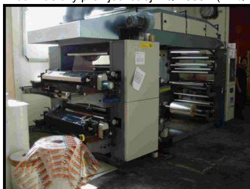
20. Potiskovací stroj YT-41000B