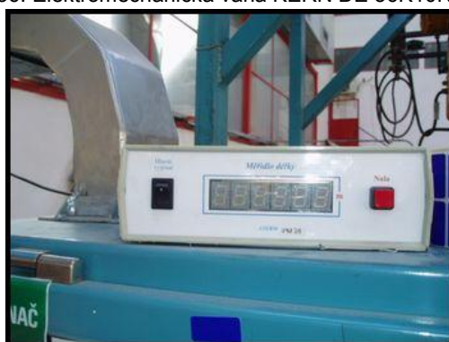
38.-40. Měřič délky ALTERM