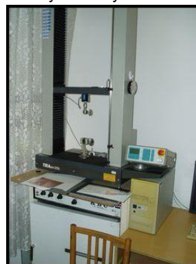
45. TIRATEST 2705