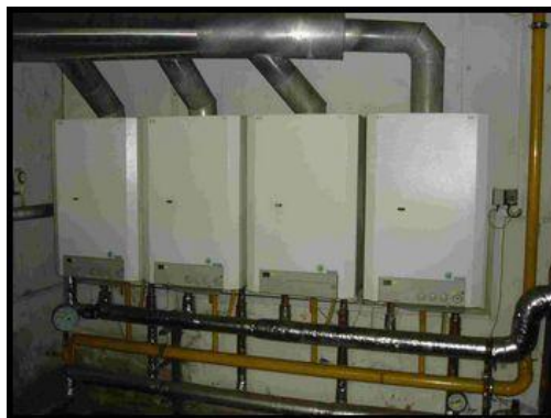
58. Kotel THERMONA 45 kW