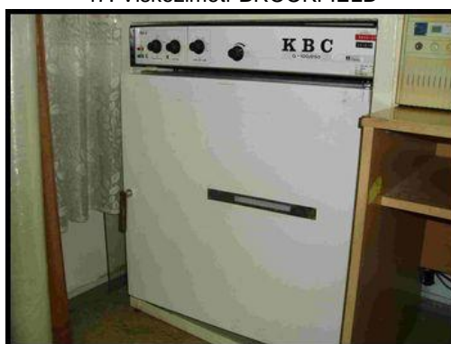
50. Sušící pec KBC G-100/250