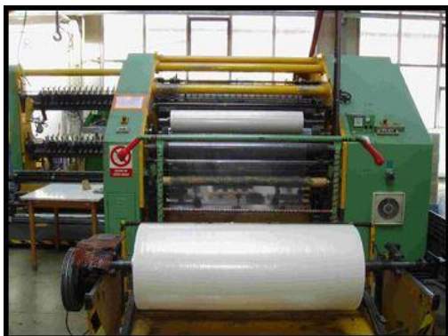
1. Řezací a převíjecí stroj TAG330