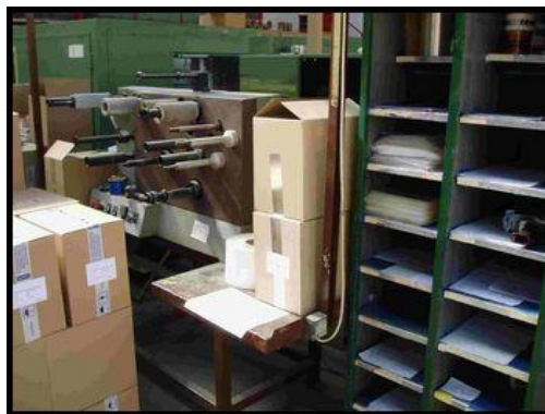
32. Převíjecí stroj R-150