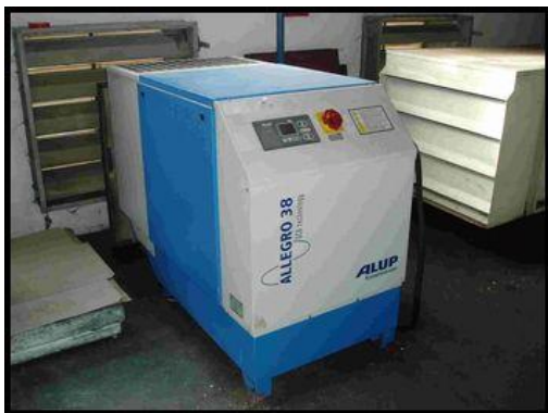
13. Šroubový kompresor ALLEGRO 38