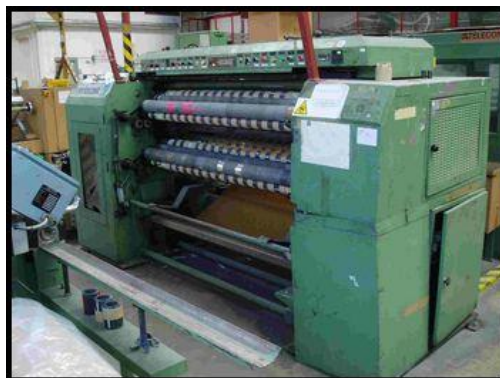
30. Řezací a převíjecí stroj TAG330