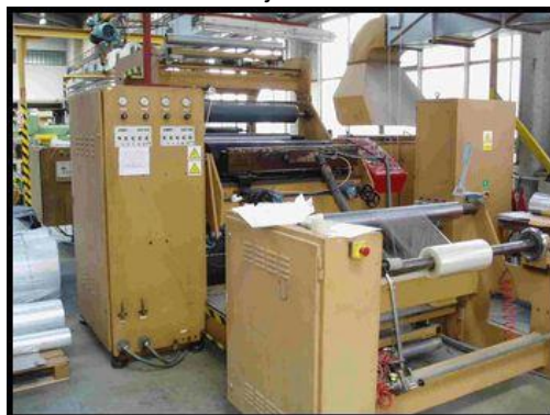
28. Nanášecí linka MELTEX CT1200