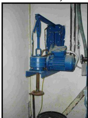
11. Nástěnná míchačka pomaluběžná