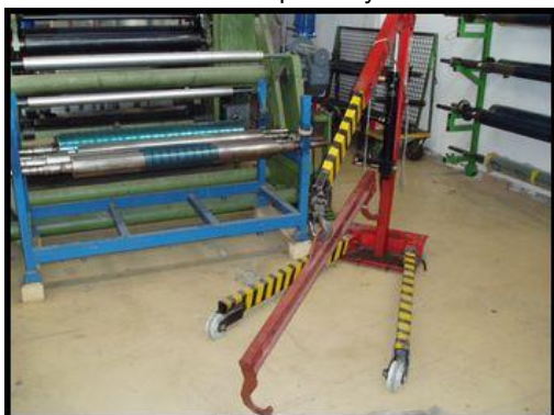
44. Jednoramenné zdvihací zařízení JR5S