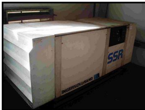
14. Šroubový kompresor SSR MH-45