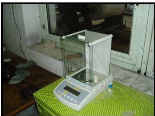
46. Analytická váha KERN ALS 120-4