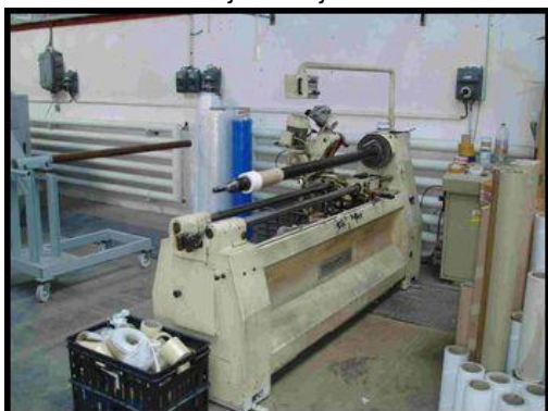
33. Upichovací stroj G&A