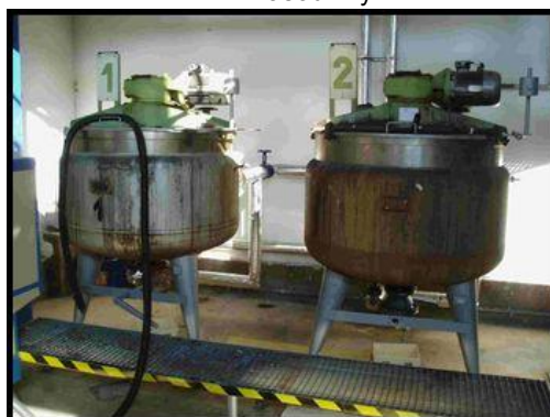
9.-10. Míchačka hotmeltových lepidel CM500