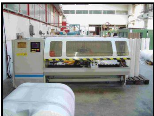
19. Jednohřídelový řezací stroj WQ-B ( WQ-701 )