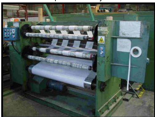
35. Řezací a převíjecí stroj OLD 330