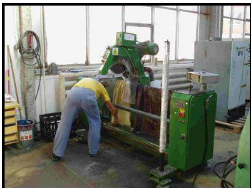
29. Kotoučový řezací stroj MK 1250