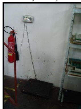
36. Elektromechanická váha KERN DE 36K10NL