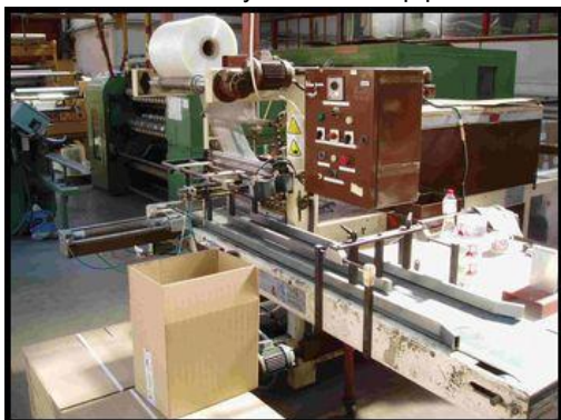
27. Balící linka TP600