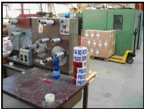
31. Převíjecí stroj L33-150