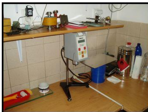
47. Viskozimetr BROOKFIELD