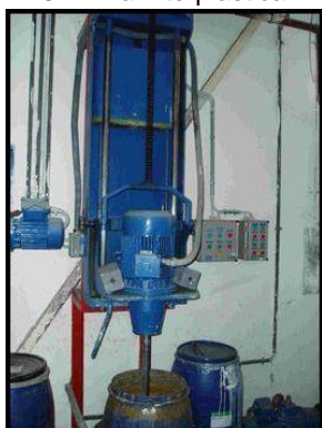
8. Nástěnná míchačka vysokootáčková