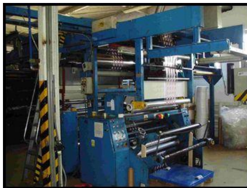
24. Potiskovací stroj EURAFLEX 1300