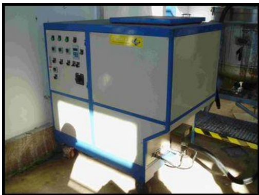
21.-23. Zařízení na tavení lepidel JYP130