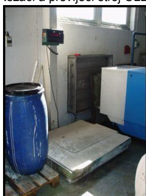
37. Elektromechanická váha můstková PESAJE 500