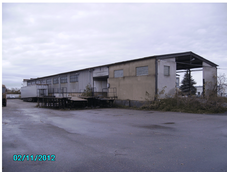
Dtto zezadu s ocelovou nakládací rampou