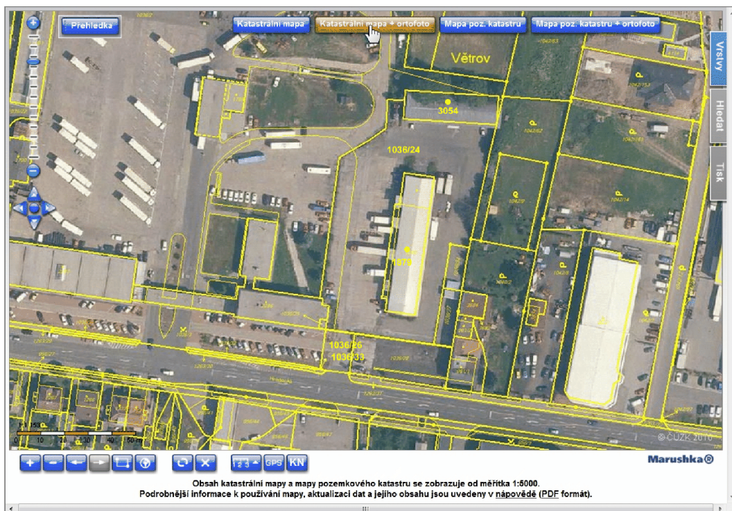
Letecký snímek s katastrální mapou