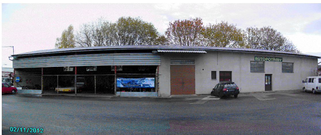
Sklad na p.p.č. 3054