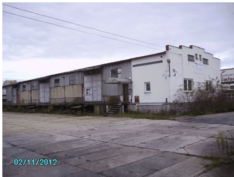
Sklad na p.p.č. 1879 - pohled od vjezdu