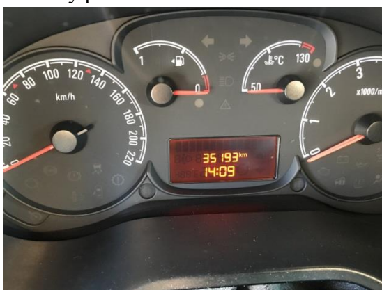
Sdružené přístroje vozidla