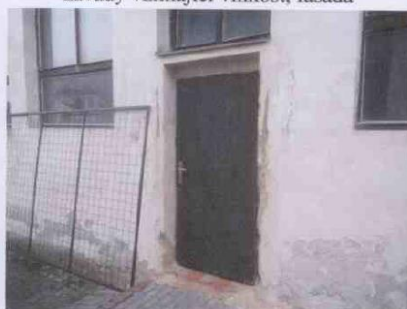
závady vztlínající vlhkost