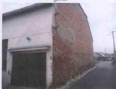
SZ štítová zeď bez omítky