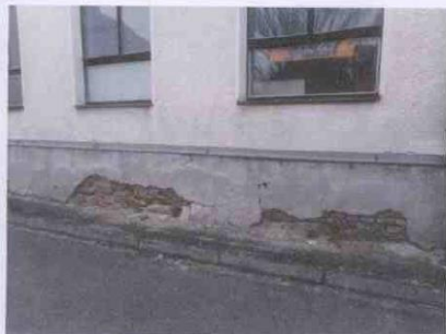
závady vztlínající vlhkost, fasáda