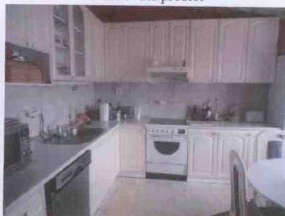
byt - kuchyně