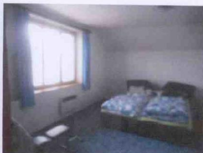
byt - podkroví